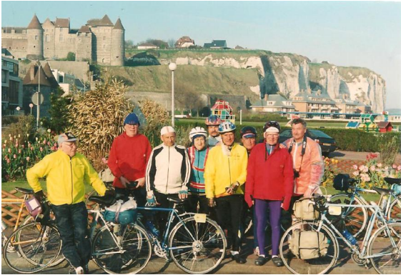
A Paris Dieppe Evreux en 1996