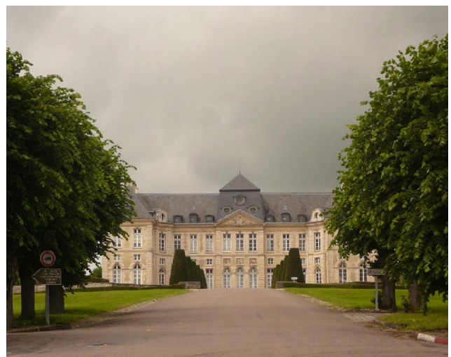
Brienne le Château