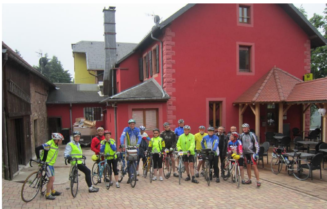
Départ du Col du Donon