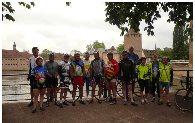
Strasbourg : La Petite France

On récupère nos vélos et bagages, après un bisou à tous, nous sommes contents d'avoir terminé notre 3 ème Mer-Montagne, malgré le temps maussade. Vivement l'année prochaine.