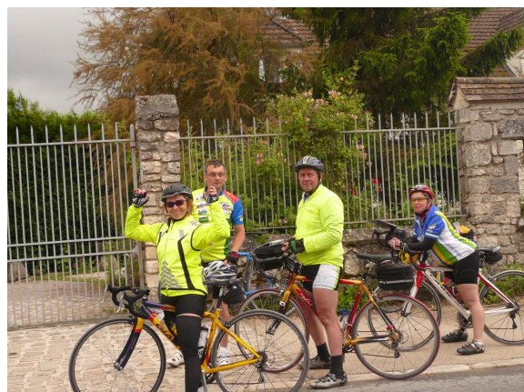
Bonjour tout le monde

Vendredi 21 juin 2013 : La Ferté sous Jouarre – Provins – Cézanne – Arcis sur Aube 160 km 875 m de dénivelé.