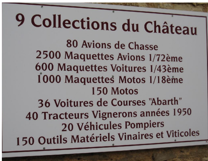
Château de Savigny

une descente rapide nous amène à PONT D'OUCH. La D 18 longe le canal de Bourgogne. Le chemin de halage n'est pas bitumé..dommage.