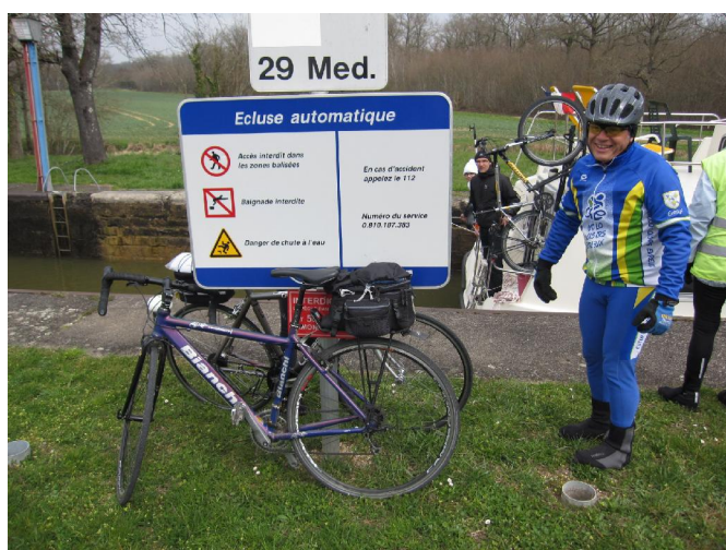
Ecluse sur le canal du centre