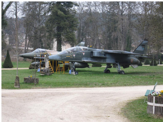
2 avions à réaction

Toujours la fraîcheur, pour traverser BEAUNE, que le vélo permet de visiter assez rapidement. Par contre au château de Savigny, il est trop tôt pour la visite, mais 2 avions à réaction sont en expo dans le parc. Nous remontons la vallée du RHOIN, jusqu'à BOUILLAND, puis la D18 nous conduit à BECOUP où