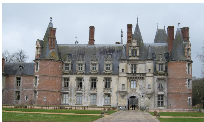
Château de Maintenon