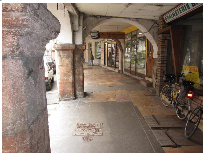
Les couverts de Louhans

Nous avons descendu vélos et bagages. Les copains n'ont plus qu'à changer de tenue et en route pour 82 km et IZERNORE (BPF 01) pointage et à ORGELET , contrôle du rayon d'or. Le parcours est très vallonné (nous sommes dans le Jura !!!!) 1000 mètres de dénivelé. Nous arrivons à 19h à Cuiseaux au logis de France, bien accueilli par le patron qui nous a concocté un fameux potage, quiche salade, lieu au citron et riz, puis crème brûlée pour nous requinquer. La température ressentie a été très froide toute la journée.