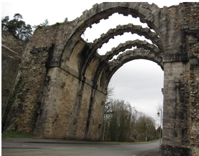
Aqueduc de Maintenon

La D21 une fois sur le plateau, le vent est favorable. MAROLLES, BU et ROUVRES puis descente sur ANET où nous contrôlons les cartes du rayon d'Or au château.