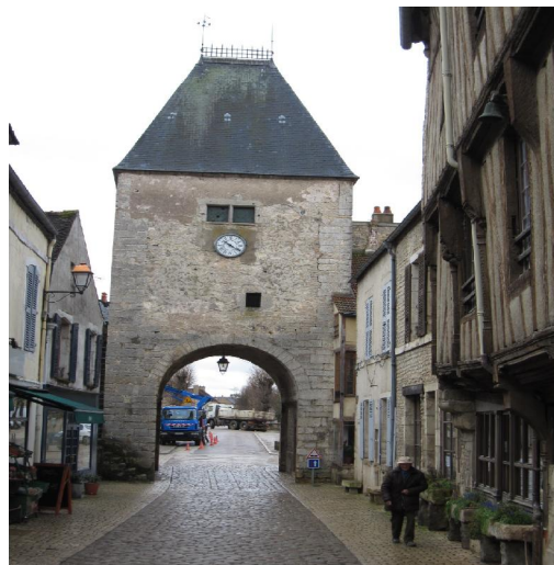
Village médiéval de Noyers sur Serein