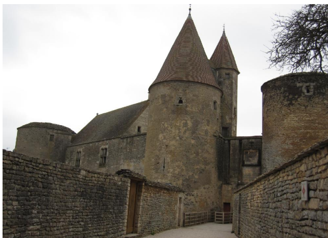
Châteauneuf en Auxois

Le vent est dans le dos jusqu'à POUILLY en Auxois, contrôle du rayon d'or, puis la D970 jusqu'à SEMUR, que nous traversons sur une route pavée qui contourne les remparts. A EPOISSES, il se met à pleuvoir, il faut bâcher. Nous faisons un crochet par le BPF de MONTREUIL sur SEREIN et c'est la descente sur Avallon où nous faisons étape ce soir après 119 km.