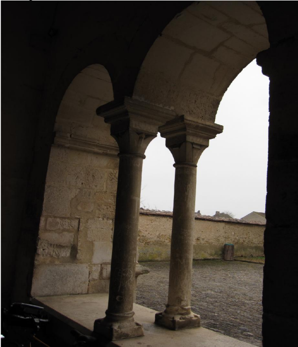
Abbaye cistercienne de Pontigny