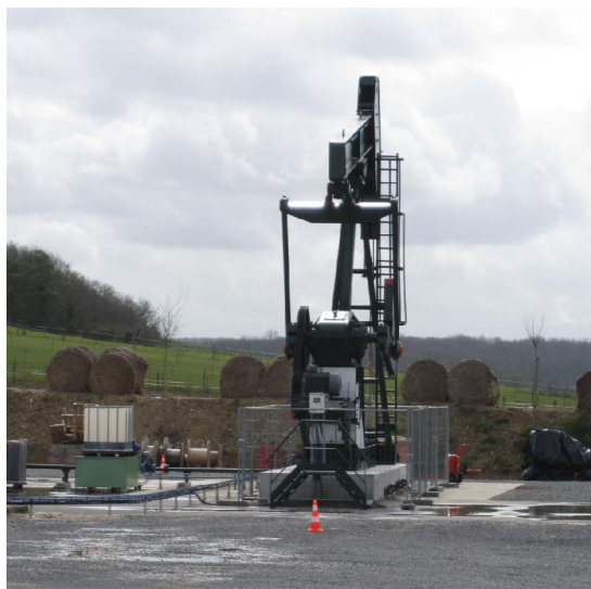
Forage de pétrole

en haut de la ville. PERDU, les visites ne commencent qu'en juin. Nous sommes quitte pour redescendre en ville, pour prendre la vallée d'Eure (Ça sent la fin du voyage) jusqu'à COULOMBS.